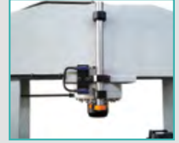
Limit Switch Limit Switch