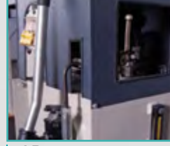
El Pompası Hand Pump