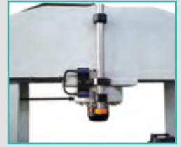
Limit Switch Limit Switch