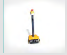
Ayak Pedalı Foot Pedal