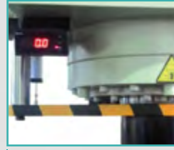
Dijital Kurs Göstergesi Digital Stroke Read out