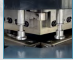
Açı Ayarlı Bıçaklar Angle Adjustable Blades

HYDRAULIC VARIABLE ANGLE CORNER NOTCHERS