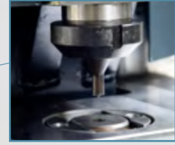
Zimba İstasyonu Punch Unit