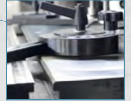
Açı Ayarlı Gönye Angular Cutting