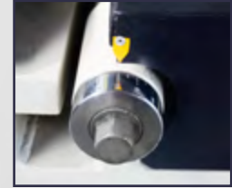
Bıçak Sentil Ayarı Blade Gap Adjustment