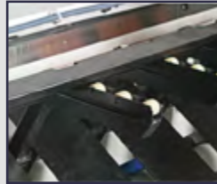
Pnömatik Sac Destek Sistemi Pneumatic Sheet Support