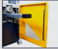
Işık Koruma Bariyeri Light Curtain