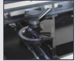
0-180° Ayarlanabilir Gönye 0-180° Angular Cutting