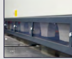
Parmak Koruma Bariyeri Finger Protection