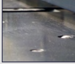
Bilyalı Ön Tabla Ball-bearing Front Table

REDÜKTÖRLÜ GIYOTİN MAKAS MECHANICAL GUILLOTINE SHEAR