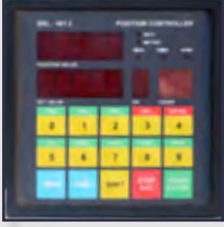
BRL NC Kontrol BRL NC Control