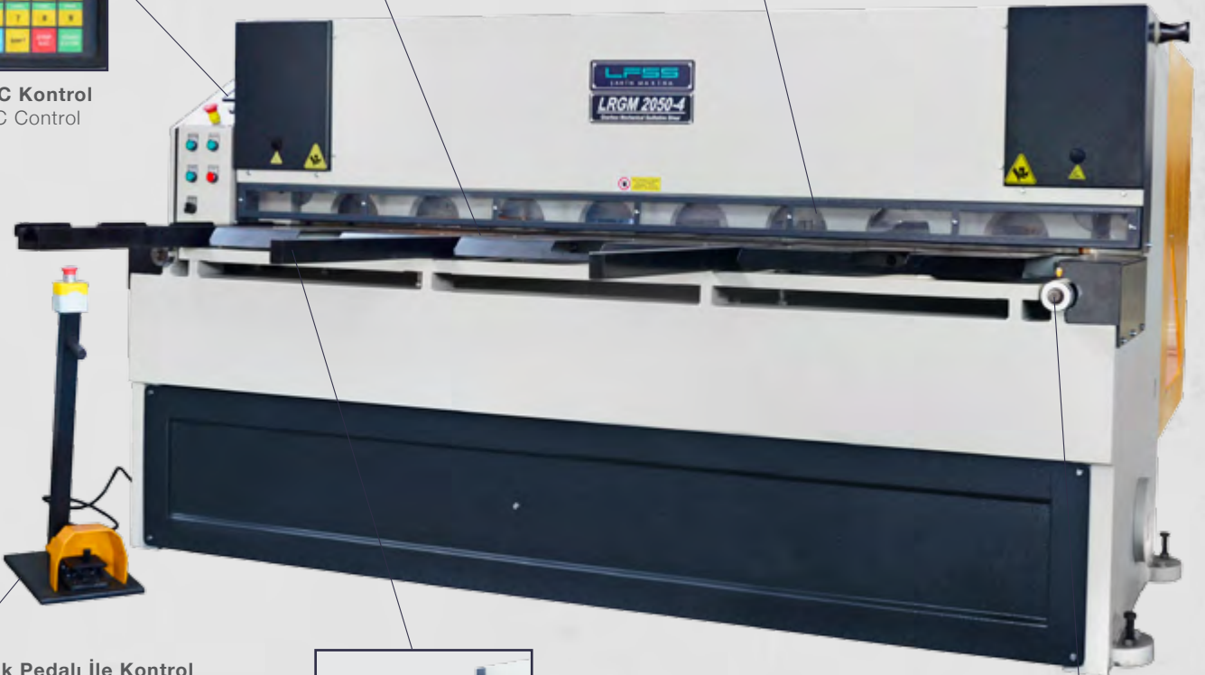
Ayak Pedalı İle Kontrol Foot Pedal Control