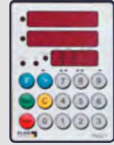
ELGO P9521 NC