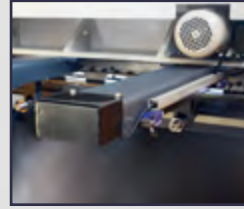
NC Kontrollü, Motorlu 750mm ve 1000mm Arka Dayama Motorized 750mm or 1000 mm NC Back Gauge